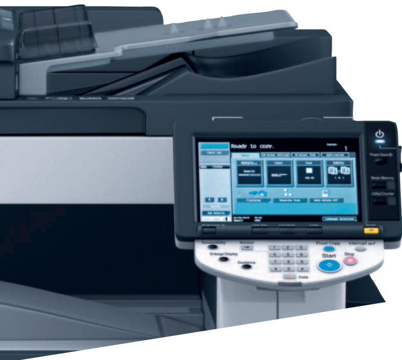
Écran tactile couleur facile à utiliser

L'excellente qualité d'impression et un grand choix de fonctions de finition permettent d'imprimer en interne des documents professionnels tels que des brochures. Ajoutez à cela les modules d'agrafage et de perforation, et votre productivité gagne encore en efficacité.