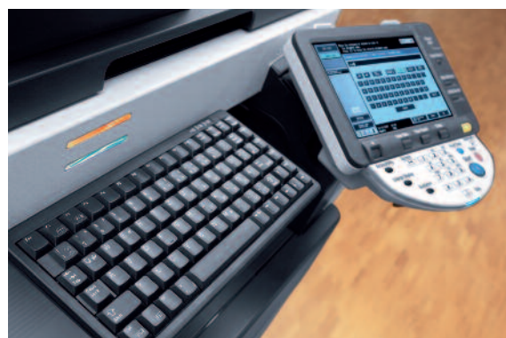
Écran tactile couleur de l'ineo 223 avec clavier optionnel

Une équipe idéale : Utilisez l'ineo 363 pour toutes vos impressions et copies monochromes et les systèmes couleur ineo+ pour obtenir des documents couleur de qualité professionnelle – une combinaison économique pour l'ensemble de votre production documentaire haute qualité.