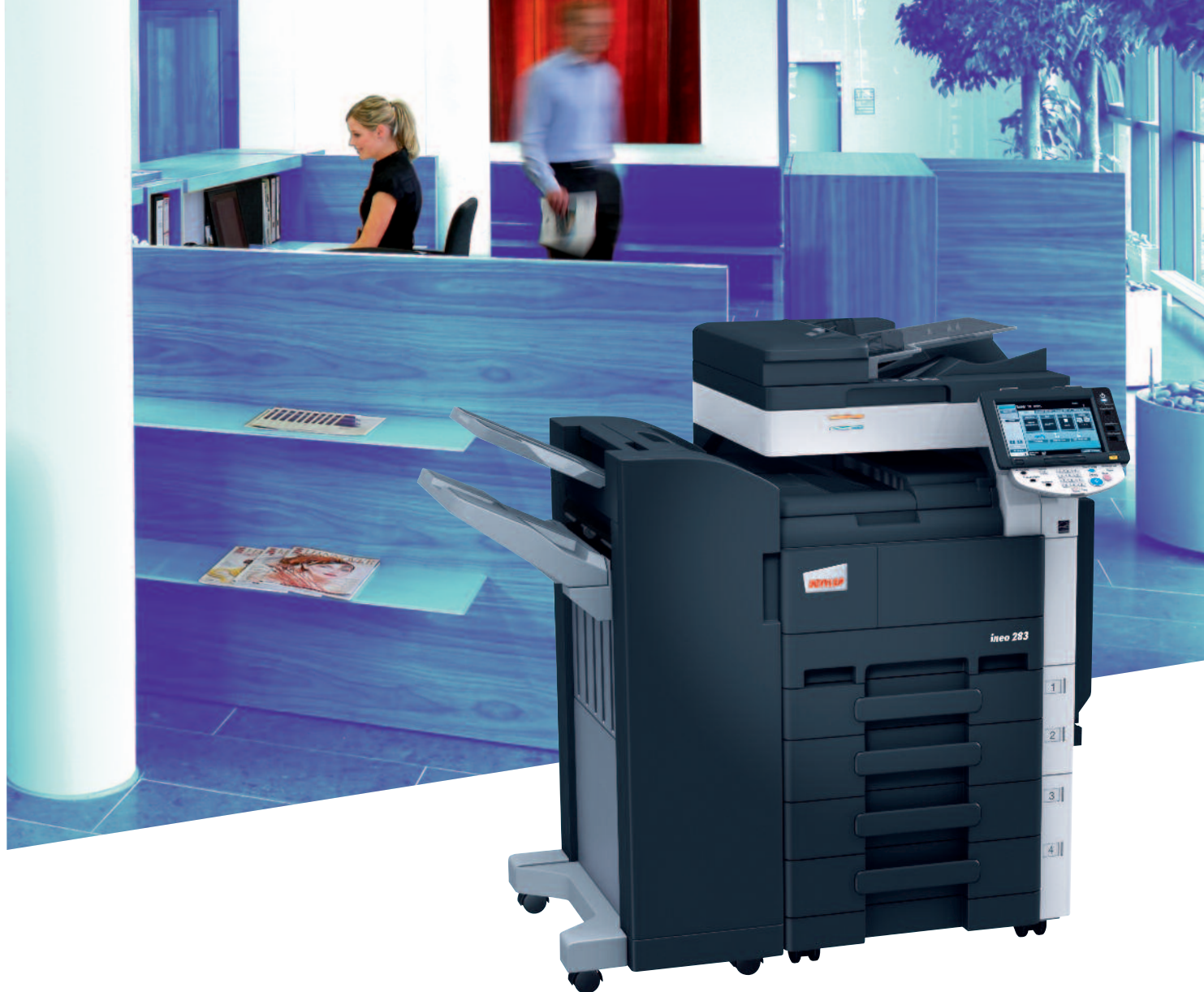
ineo 283 avec module de finition agrafage (FS-527), magasin papier (PC-208) et chargeur de documents (DF-621)